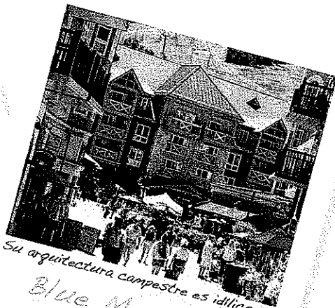
Su arquitectura campestre es idílica Blue Mountain