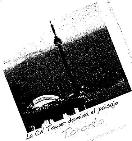
La CN Tower domina el paisaje Toronto