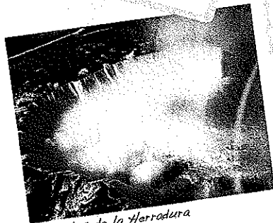
Cataratas de la Herradura Niagara

Puedes comenzar tu recorrido por uno de los museos de la ciudad, como el Royal Ontario Museum o el Bata Shoe Museum—donde se explica la historia del calzado— y culminar tus actividades con una obra de teatro en el Entertainment District. Por supuesto, no dejes de visitar el Distillery District, donde hay una destilería de whiskey del siglo XIX que está rodeada por tiendas, galerías de arte y restaurantes con música viva.